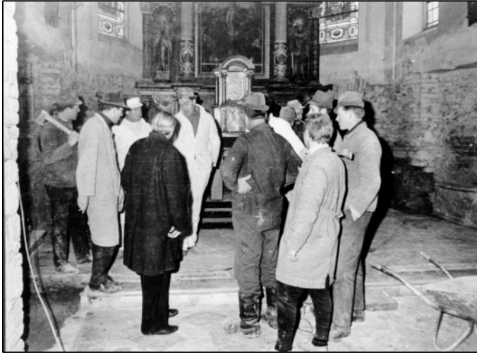
Innenarbeiten in der Pfarrkirche