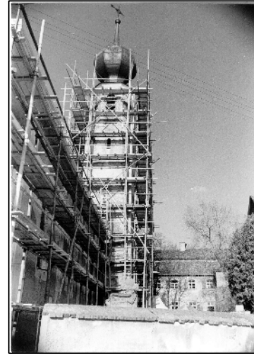
Die Außenrenovierung der Pfarrkirche