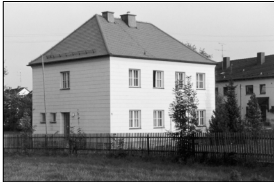
Der neu erbaute Pfarrhof an der Hauptstraße

Ziel der Stiftung war, möglichst viele Jugendliche im christlichen Geist zu erziehen und für die praktische Schul- und Berufsarbeit vorzubereiten. Besonders beliebt waren die Handarbeiten und das Schneidern in der Nähsschule, wo vielerlei genäht, gestrickt und gehäkelt wurde. In der Regel waren 3 bis 5 Franziskaner Schwestern in Köfering tätig. Alle Schwestern wurden 1959 aufgrund des zerstörten Klösterls ins Mutterhaus nach Mallersdorf abgezogen.