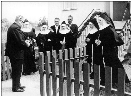
Empfang der Mallersdorfer Schwestern