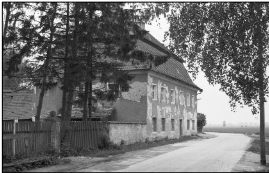
Der alte Pfarrhof wurde 1789 erbaut