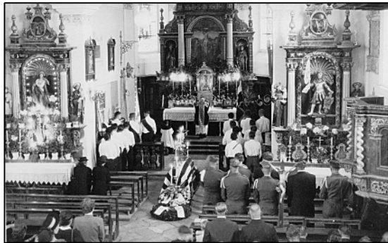
Die Pfarrkirche St. Michael um 1955

In den 60iger Jahren begann der Pfarrer mit umfangreichen Sanierungen in der Pfarrkirche St. Michael Köfering. Die gesamte Kirche sollte der Zeit entsprechend modernisiert werden, der Hochaltar und die beiden Seitenaltäre wurden entfernt, die Kanzel, die Kommunionbank die Beichtstühle und der hölzern gefasste Kreuzweg wurden entfernt. Im vorderen Kirchenbereich wurden wegen der großen Feuchte, die Sollnhofer Bodenplatten entfernt und der ganze Bereich trocken gelegt.