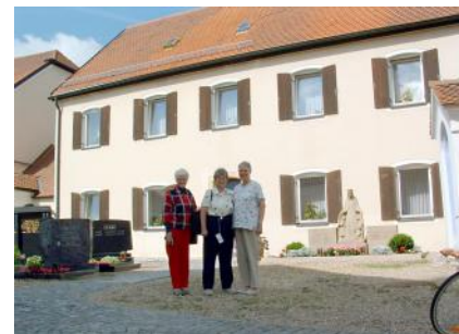
Schwestern vor der Schule