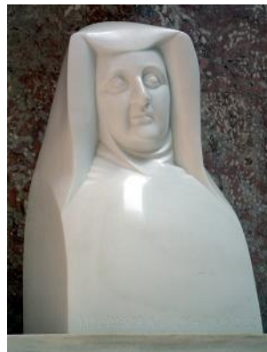
Ein Besuch in der Walhalla war sichtlich der Höhepunkt des Tagesausflugs.