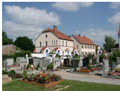
Friedhof mit alter Schule