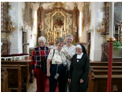
Die Schwestern in der Mintrachinger Kirche

Ich kutschierte mit meinem PKW die drei Schwestern einen Tag lang in der Gegend herum, suchte mit ihnen die Wirkungsbereiche bis nach Geiselhöring auf und zeigte ihnen auch die Walhalla, in der sich auch eine Marmorbüste von Schwester Gerhardinger befindet. Mein Lohn für meinen Aufwand und die Ausgaben war ein herzliches „vergelt's Gott“ welches ich gerne angenommen habe. Wenn sich andere Menschen über Kultur- und Heimatpflege rühmen, praktiziere ich Gastfreundschaft ohne Spesenvergütung auf meine eigenen Kosten.