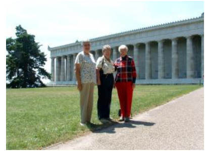
Vor der Walhalla