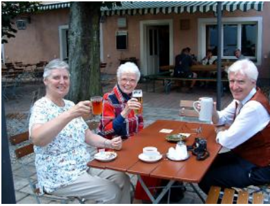
Zwischenpause in Geiselhöring beim Erl-Bräu